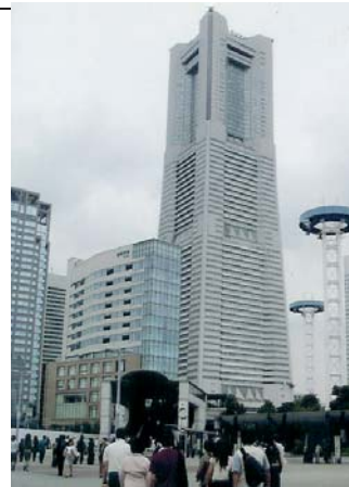
ランドマークタワーへGO!

去る九月二十六日は、納涼祭も終わり、秋めいてきた曇りの日に実施されました。デイケアを午前十時半頃に出発し、合計八名で、電車に乗りました。看護師のKさんと、メンバーのOさん、Mさんと私は、席が空いてなかったため、優先席に座