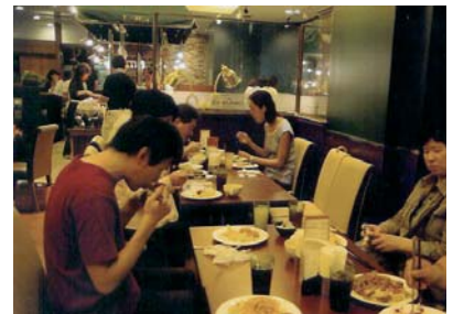
バイキングレストランでのひととき