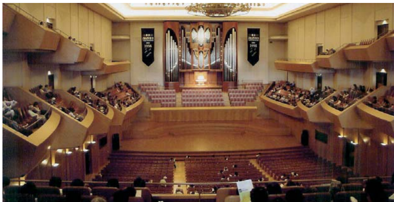
みなとみらいホールとパイプオルガン

上り、ぶらぶらと歩いていきました。途中、ショッピングを楽しむ時間の余裕は、ありませんでしたが、中を通り、エスカレーターを降りると、そこには、巨大なオブジェが、待ち構えていました。そのビルの中を進んでいくうちに