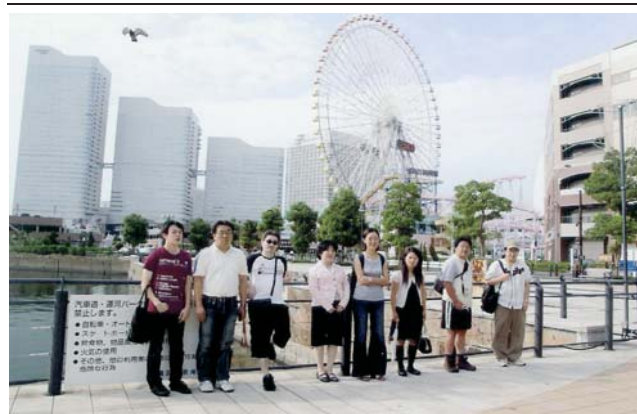
観覧車を背にして