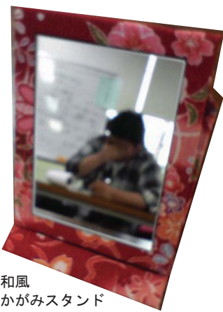
和風かがみスタンド

簡単に作れるキットの存在も一役買っています。これによりカタログから注文してトライしようというメンバーさんも多いです。