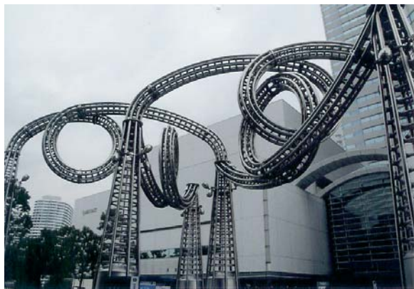
巨大なオブジェが出迎えてくれます。

り、談笑しているうちに、大船駅から、桜木町に着き、人ごみの中、無事駅を降りました。そびえ立つランドマークに圧倒されながら、エスカレーターを