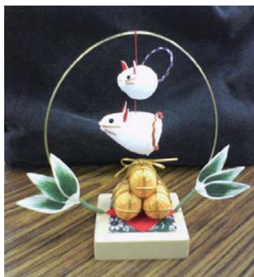
かわいいネズミの置物

これまで主流だったビーズ作品の他にも和小物やキルト、カギ編み、プラモなどなど、机に向かって真剣に、はたまたおしゃべりに華を咲かせながら作業を楽しむメンバーさんが続出！